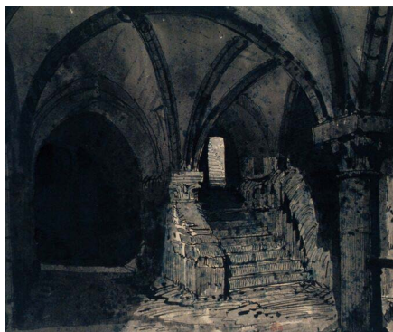
Escalier des cachots , dessin à la plume et lavis à l'encre de Chine, 1842, BnF, Paris.