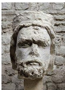
Tête de roi de Juda, Notre-Dame de Paris, galerie des Rois, Paris, vers 1220, calcaire 62 x 33 x 46 cm, musée de Cluny, Paris.