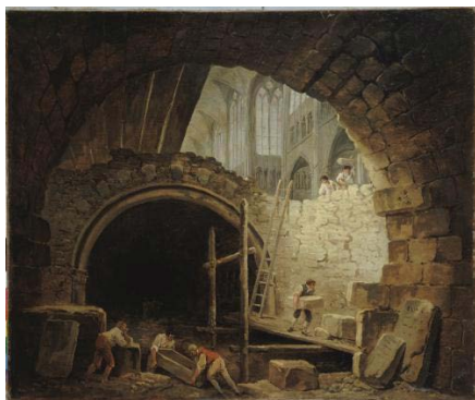
Hubert ROBERT, La violation des caveaux des rois dans la basilique Saint-Denis en octobre 1793 , 1793, huile sur toile, Musée Carnavalet, Paris.

Le lien étroit du monument avec le pouvoir religieux et monarchique aboutit à la destruction de la fameuse galerie des Rois (1220-1230) de la façade occidentale, en raison d'une assimilation précoce entre ces 28 statues représentant les rois de Juda et la généalogie des rois de France. Les têtes de ces statues sont décapitées en 1793 et les fragments vendus comme pierre à bâtir. En 1977, 21 de ces têtes sont redécouvertes et aujourd'hui conservées au musée national du Moyen Âge.