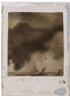
Victor HUGO, Le Mont Saint-Michel , dessin au pinceau, encre brune, dessin à la plume, 68 x 59 cm, maison Victor Hugo, Paris.