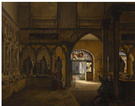
Charles-Marie BOUTON, Vue de la salle du XIVe siècle au musée des Monuments français , 1817, musée de Bourg-en-Bresse, Bourg-en-Bresse.