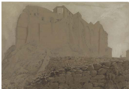
Eugène VIOLLET-LE-DUC, Escarpement du Mont Saint-Michel , 1836, aquarelle, 29 x 42 cm, MPP, Charenton-le-Pont.